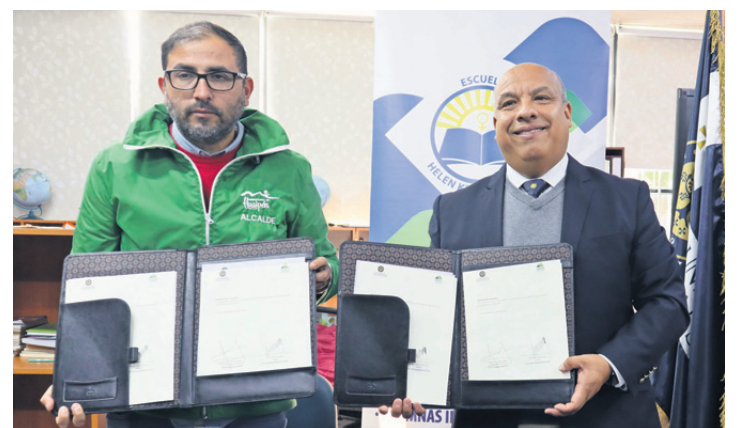
El convenio beneficiará a 18 instituciones educacionales.