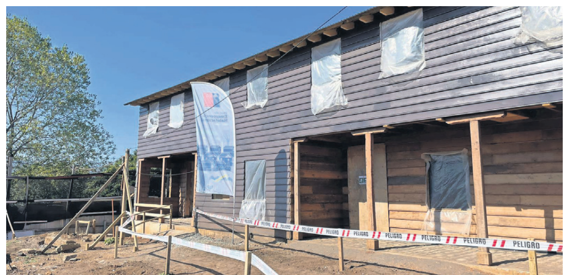
La reparación también incluye obras de ampliación.

El pabellón 55 fue constituido por 26 casas en dos pisos. El proyecto actual considera 19 viviendas porque algunas familias ocupan dos unidades originales, lo que se respetó en la propuesta de